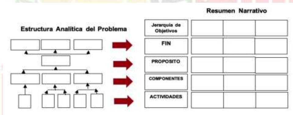
Diagrama del resumen narrativo de la MIR

En el anexo 3 se presenta un ejemplo de "Resumen Narrativo de la MIR"